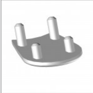
Pattino di scorrimento per pavimentazioni morbide ed irregolari (per modelli Flou, laMia e Volée)