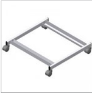
Carrello in metallo verniciato nero, completo di ruote