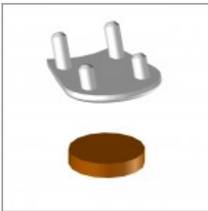
Pattino di scorrimento con feltro per pavimentazioni delicate (per modelli Flou, laMia e Volée)