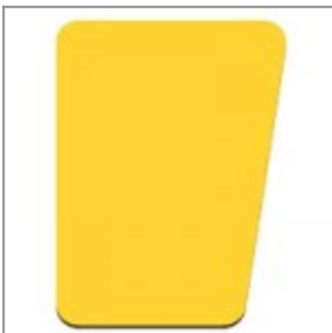
Tav. scrittoio sinistra guardando, in faggio ver.to naturale, utilizzabile con snodo ZST15M