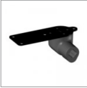
Snodo antipanico, destro da seduti, per tavoletta scrittoio modd. ZATV10P90, ZATV10L06