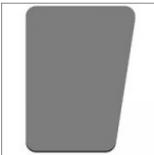
Tavoletta scrittoio sinistra guardando, in PS nero, utilizzabile con snodo ZST15M