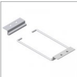
Aggancio lungo sedia con 2 braccioli e tavoletta scrittoio