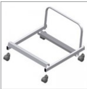
Carrello di servizio porta-sedie, completo di ruote