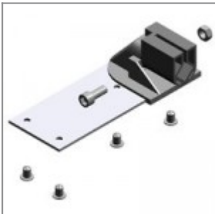
Snodo con piastra di fiss. in metallo per tavolette scrittoio, dx e sx, per modd. ZTF2635, ZTP2635, ZTF2635DX