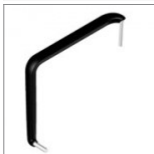
Bracciolo Alina, sinistro guardando, in poliuretano