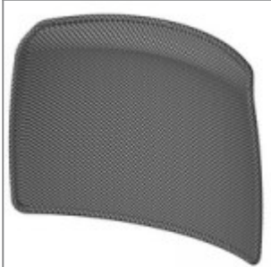
Schienale Alina rivestito in rete nera