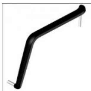
Bracciolo Alina, destro guardando, in poliuretano