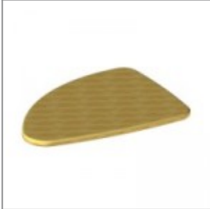
Tavoletta scrittoio antipanico, dex e six, in faggio ver.to naturale , utilizzabile con snodi modd. ZASN10P90, ZASN20P90