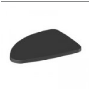
Tavoletta scrittoio antipanico in ABS nero, dx e sx, utilizzabile con snodi modd. ZASN10P90, ZASN20P90