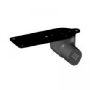
Snodo antipanico, destro da seduti, per tavoletta scrittoio modd. ZATV10P90, ZATV10L06