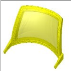
Schienale laKendò rivestito in rete grigia con supporto assemblato