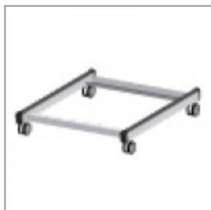
Carrello porta sedie laKendò verniciato nero con ruote