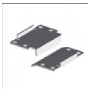
Aggancio maschio+femmina in metallo nero laKendò con braccioli