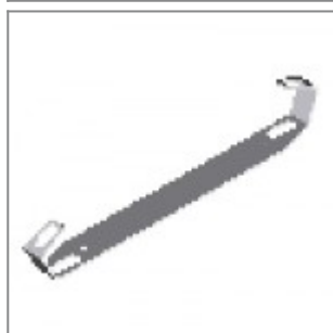
Barra distanziatrice laKendò verniciata nera, senza ferramenta