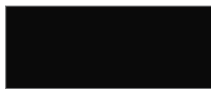
Nero - RAL 9005