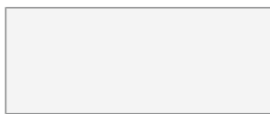
Bianco - RAL 9003