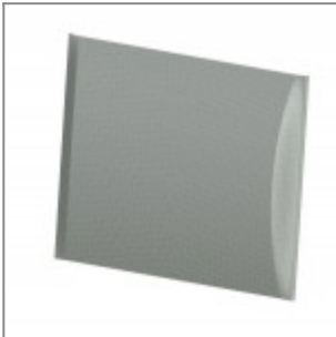
Rete bianca ignifuga per schienale S'mesh