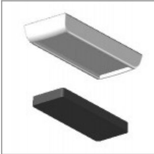
Pattino di scorrimento con feltro per pavimentazioni delicate utilizzabile su piedini di telai in tondino