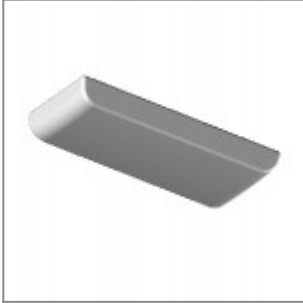
Pattino di scorrimento per pavimentazioni morbide ed irregolari utilizzabile su piedini di telai in tondino